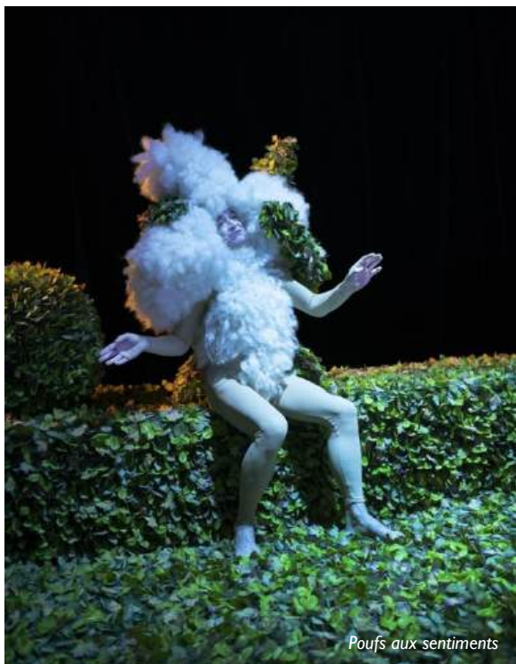
Poufs aux sentiments