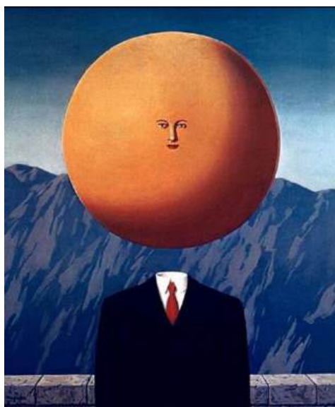
René Magritte. L'art de vivre (1967)

Coproduction : Centre National pour la Création Adaptée – Morlaix, Le CN-D Centre national de la danse, Le Théâtre, Scène nationale de Mâcon, Les Subsistances, Le Quartz – Scène nationale de Brest (en cours)