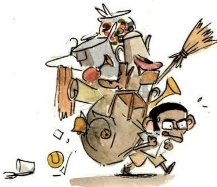
Illustration © Benjamin Renner

Comme l'expérience a pris, l'idée est venue tout naturellement de transformer ces aventures orales en petits livres. Telle est la raison d'être de cette collection. »