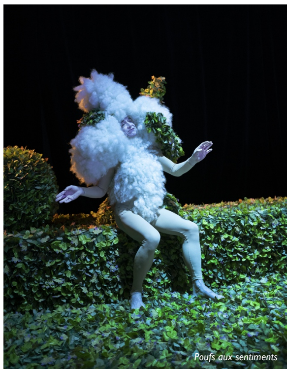
Poufs aux sentiments