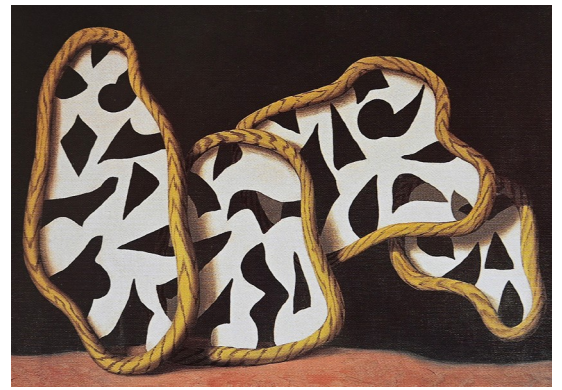
Le sens propre II (1929) / L'homme du large (1927) / La lumière magique (1928)