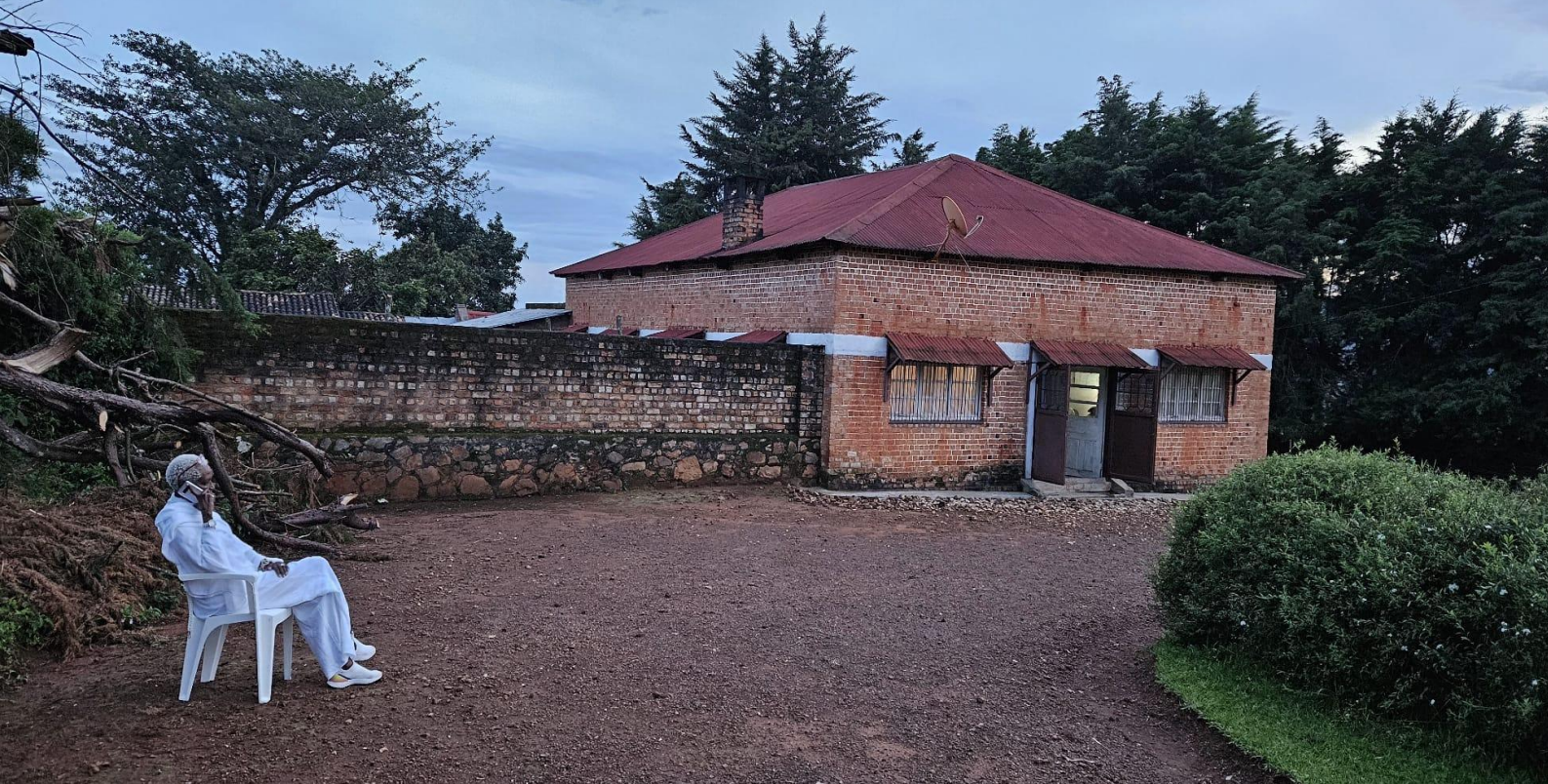
La princesse Esther Kamatari, Fota, Burundi, 2024