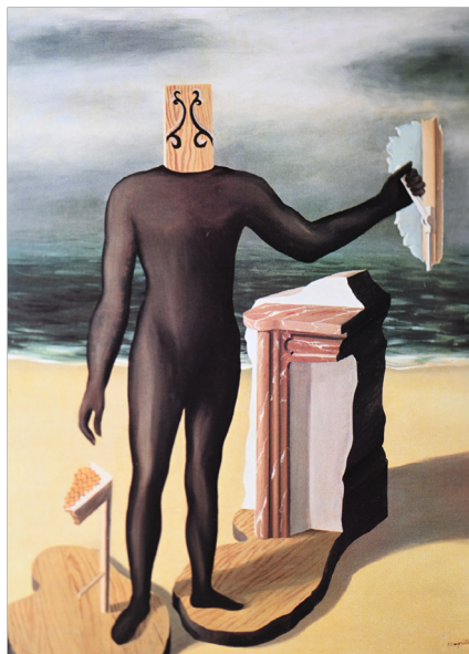
L'homme du large (1927)