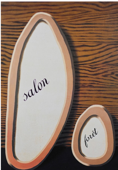
Le sens propre II (1929)

3 exemples de tableaux de Magritte dont nous nous inspirons pour les costumes et la scénographie.